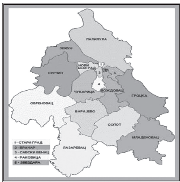
Карта 1: Београдске приградске општине (БПО) у оквиру територије Града Београда (размера 1:447.000)

Са административног становишта, БПО обухватају источни, јужни и западни део територије града Београда. Са географског становишта, оне припадају подунавском, шумадијском и посавском подручју, на контакту две велике природне целине: Панонске низије (на северу) као изразито равничарског подручја и брдовите и планинске Шумадије (на југу и југоистоку).